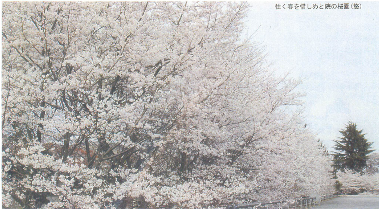
往く春を惜しめと院の桜園(悠)

発行元 独立行政法人 国立病院機構 東京病院 〒204-8585 東京都清瀬市竹丘3-1-1 TEL 042(491)2111 FAX 042(494)2168 ダイレクト・イン・ダイヤル 042(491)4134 ホームページ http://www.hosp.go.jp/tokyo/